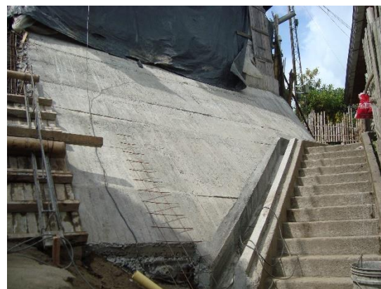
Obras que se adelantan en el frente 20 de julio.